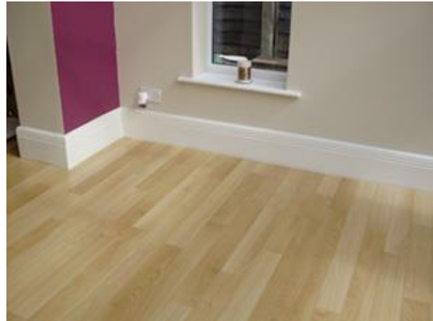
REGENCY OG szegélyradiátor profil fehér színben, egy nappaliban

A Regency OG profil kifejezetten jól alkalmazható megújuló energiaforrásokhoz. A nagyobb felület egyenletesen eloszló hőt eredményez 40 – 50 °C fokos áramlási hőmérséklet esetén is (függ az épület hőszigetelési fokától) Mivel a ThermaSkirt® szegélyradiátor a padlóburkolat szintjén kerül beépítésre, ideális megoldás meglévő ingatlanokhoz, ami azt jelenti, hogy a hőszivattyú és a napelem olyan épületben is használható, amelyeket erősen meg kellene bolygatni, szerkezeti változtatásokat kellene végezni a padlófűtés érdekében.