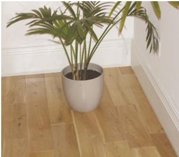
REGENCY OG szegélyradiátor profil fehér színben